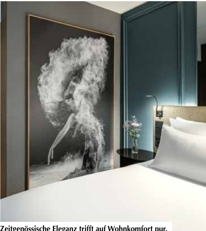
Zeitgenössische Eleganz trifft auf Wohnkomfort pur.