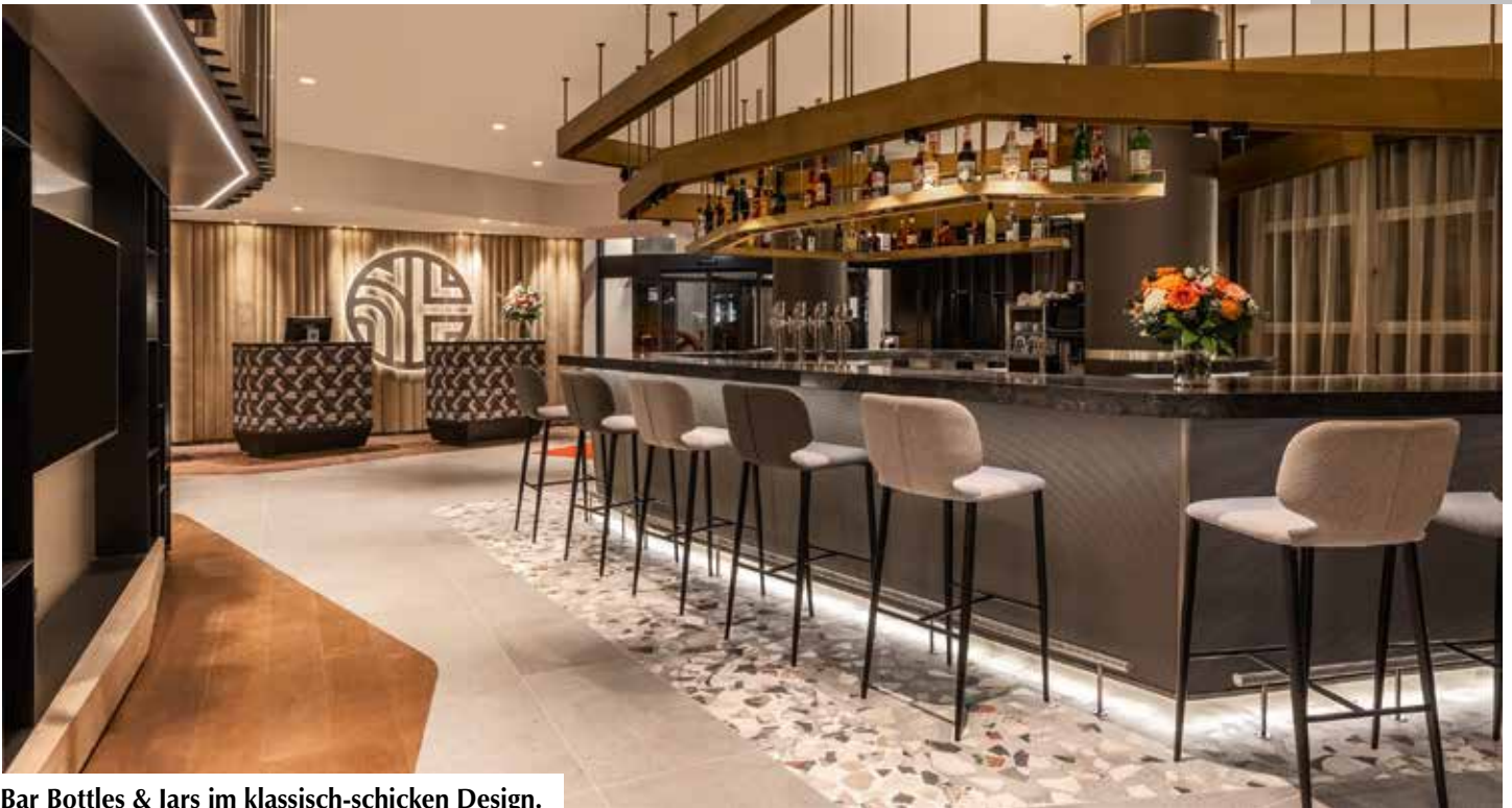
Bar Bottles & Jars im klassisch-schicken Design.