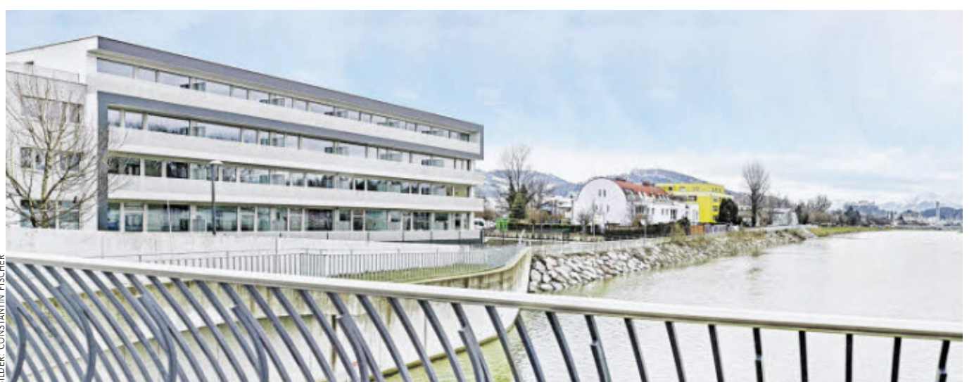
Die Aussicht auf die Salzach und den Gaisberg, die günstige Lage und die fairen Preise zählen zu den wichtigsten Pluspunkten.