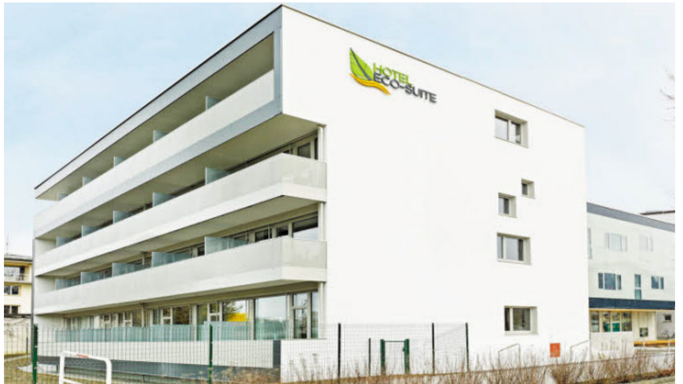
Das neue Eco Suite Hotel im Salzburger Stadtteil Itzling eröffnet am kommenden Freitag, dem 18. März.