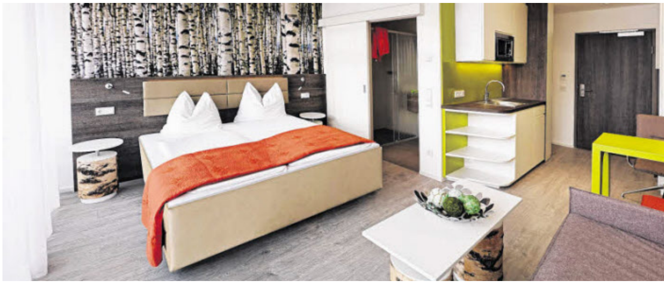
Die 44 Zimmer haben eine Größe von durchschnittlich 26 m 2 und sind alle mit Schreibtisch und Kitchenette ausgestattet.