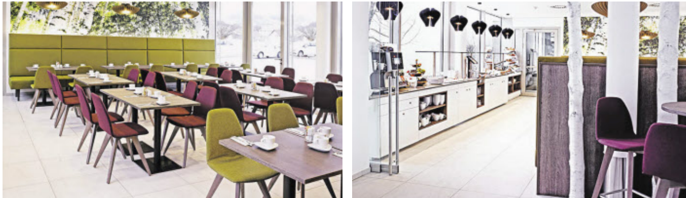
Lichtdurchflutet, modern und kommunikativ: der Frühstücksraum des neuen Eco Suite Hotel in Salzburg-Itzling.